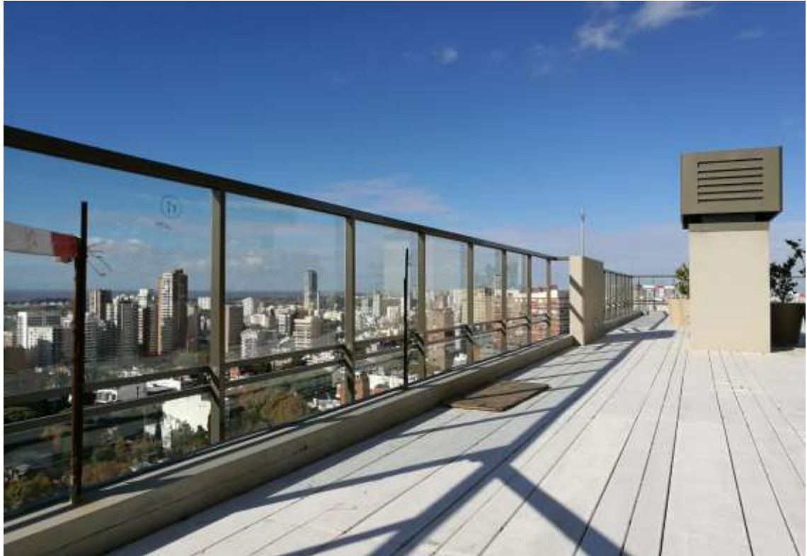
Torre Zabala – Barandas Piso 24º.