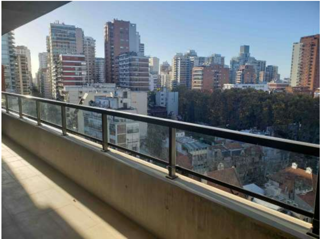
Torre Arcos – Piso 9°. Barandas de Balcón