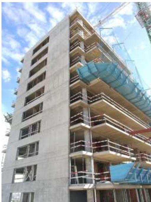
Torre Arcos – Vista Lateral