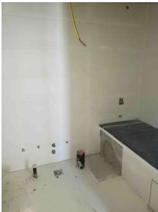
Torre Arcos- Piso 16°. Revestimientos