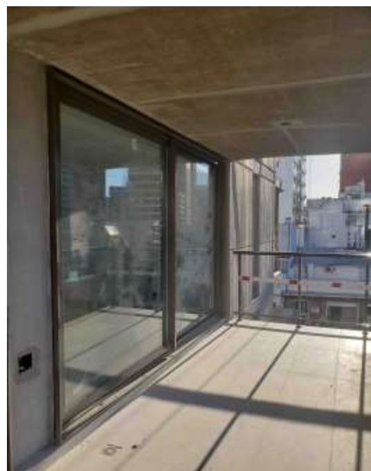
Torre Arcos – Piso 7°. Carpinterías