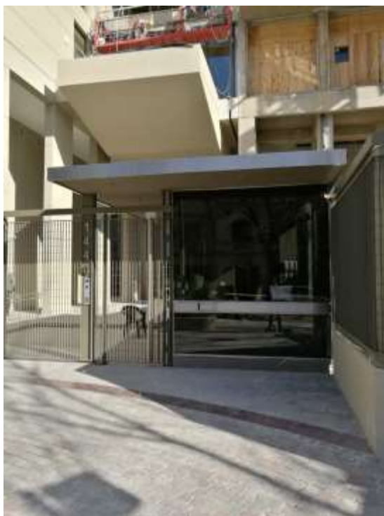
Torre Zabala – Cenefa Garita Acceso