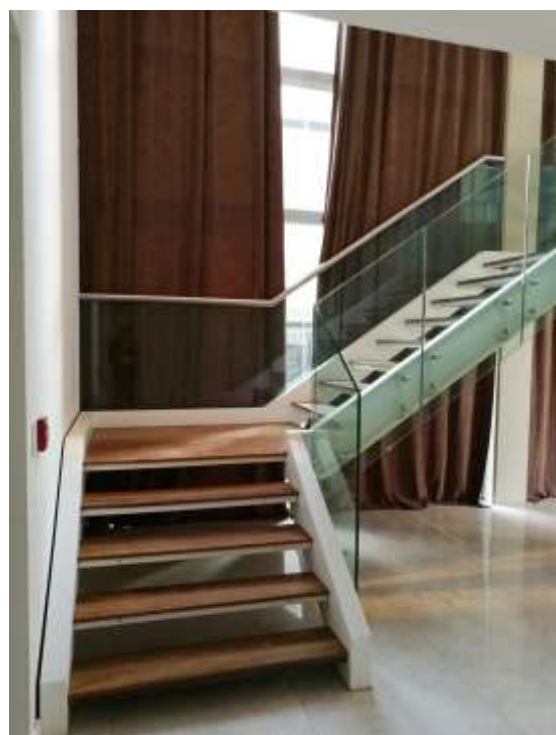
Torre Zabala – Escalera Planta Baja