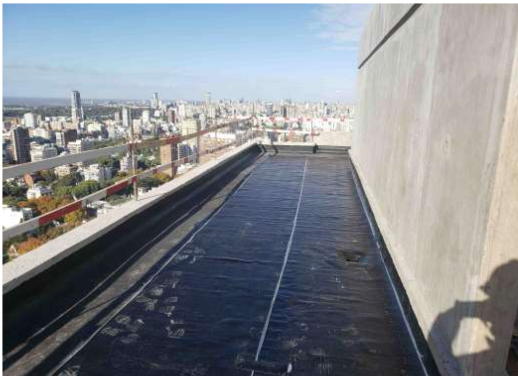
Torre Arcos – Impermeabilización Azotea