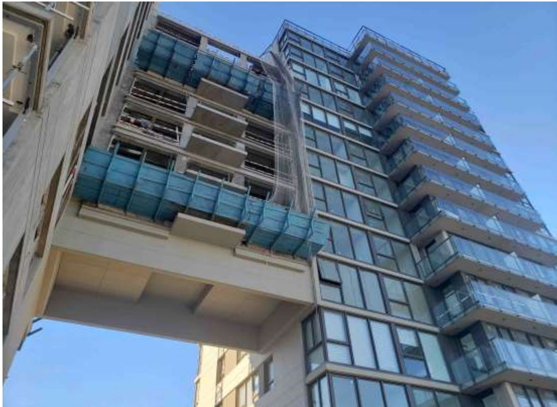
Torre Arcos – Vista Puentes Contrafrente