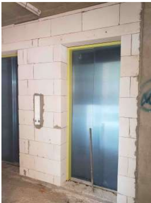
Torre Arcos – Piso 28°. Frente Ascensores