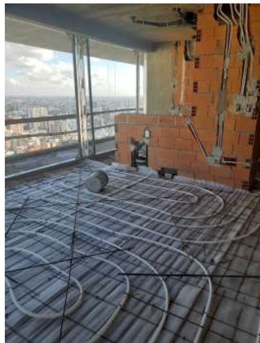
Torre Arcos – Piso 29°. Piso Radiante