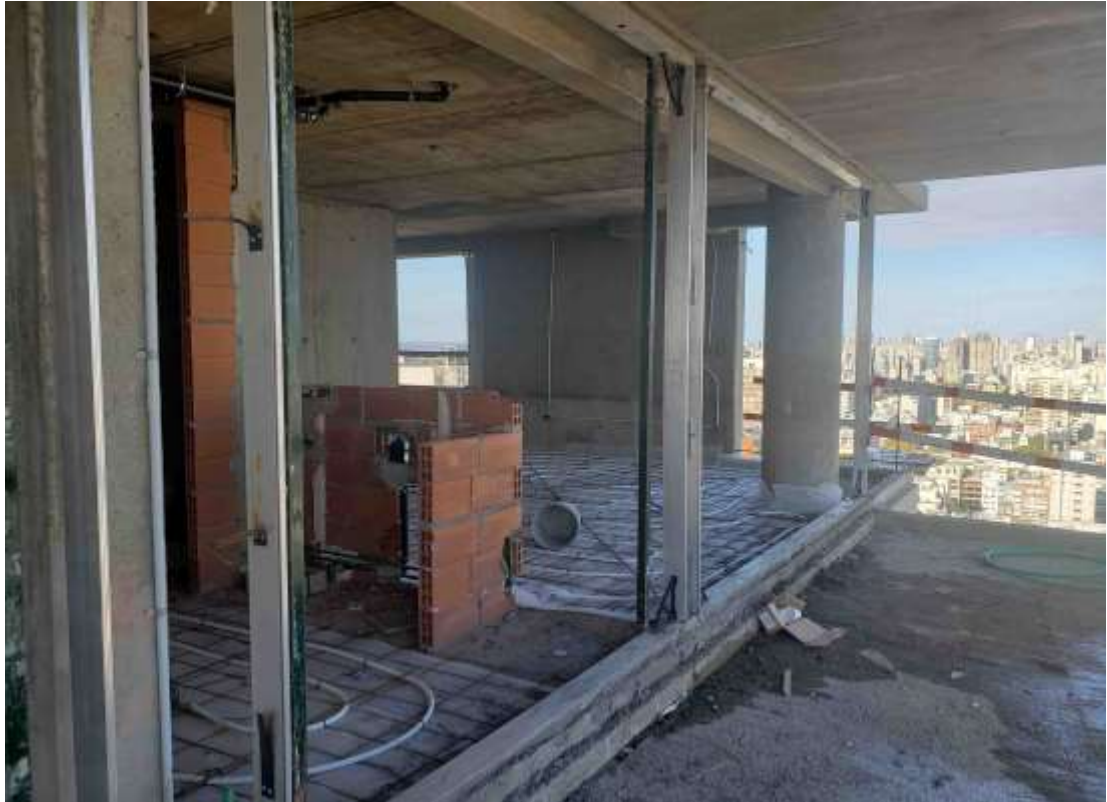
Torre Arcos – Piso 28°. Colocación Premarcos