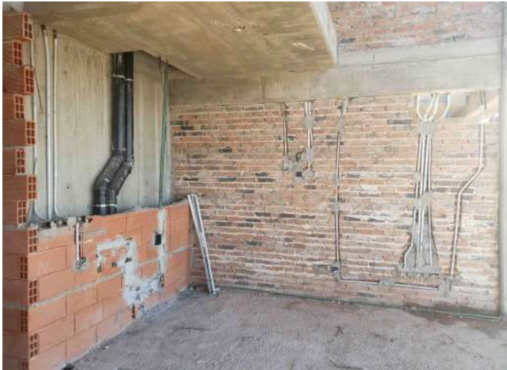
Torre Arcos – Piso 33°. Instalación Sanitaria y Eléctrica