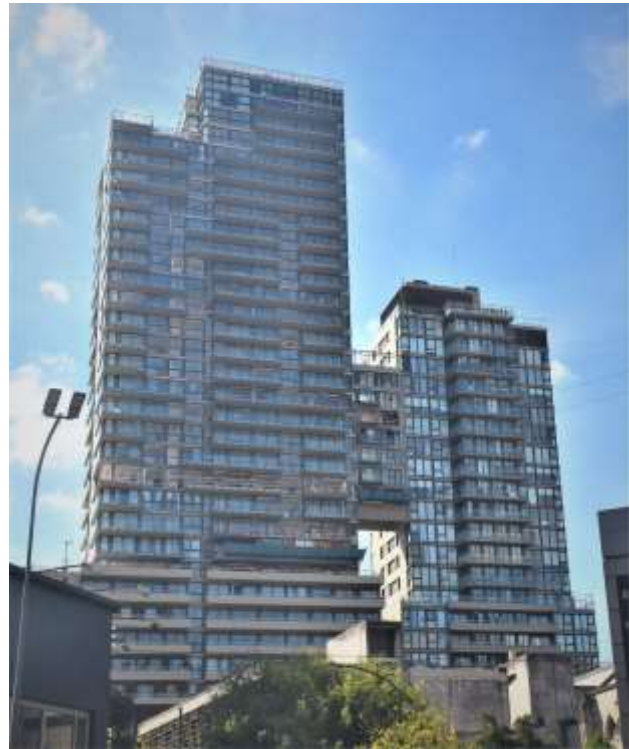
Vista desde Avenida Cabildo