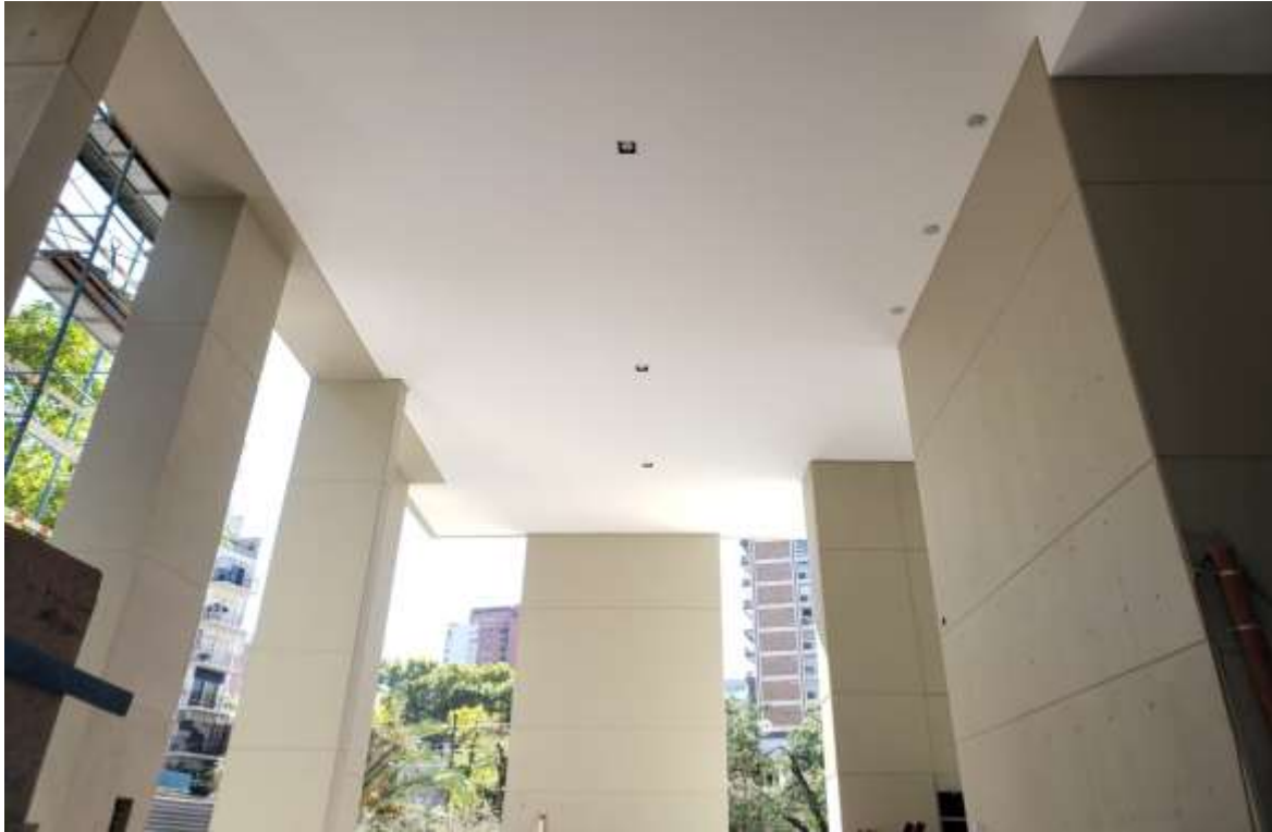
Planta Baja – Pintura Paramentos y Cielorraso