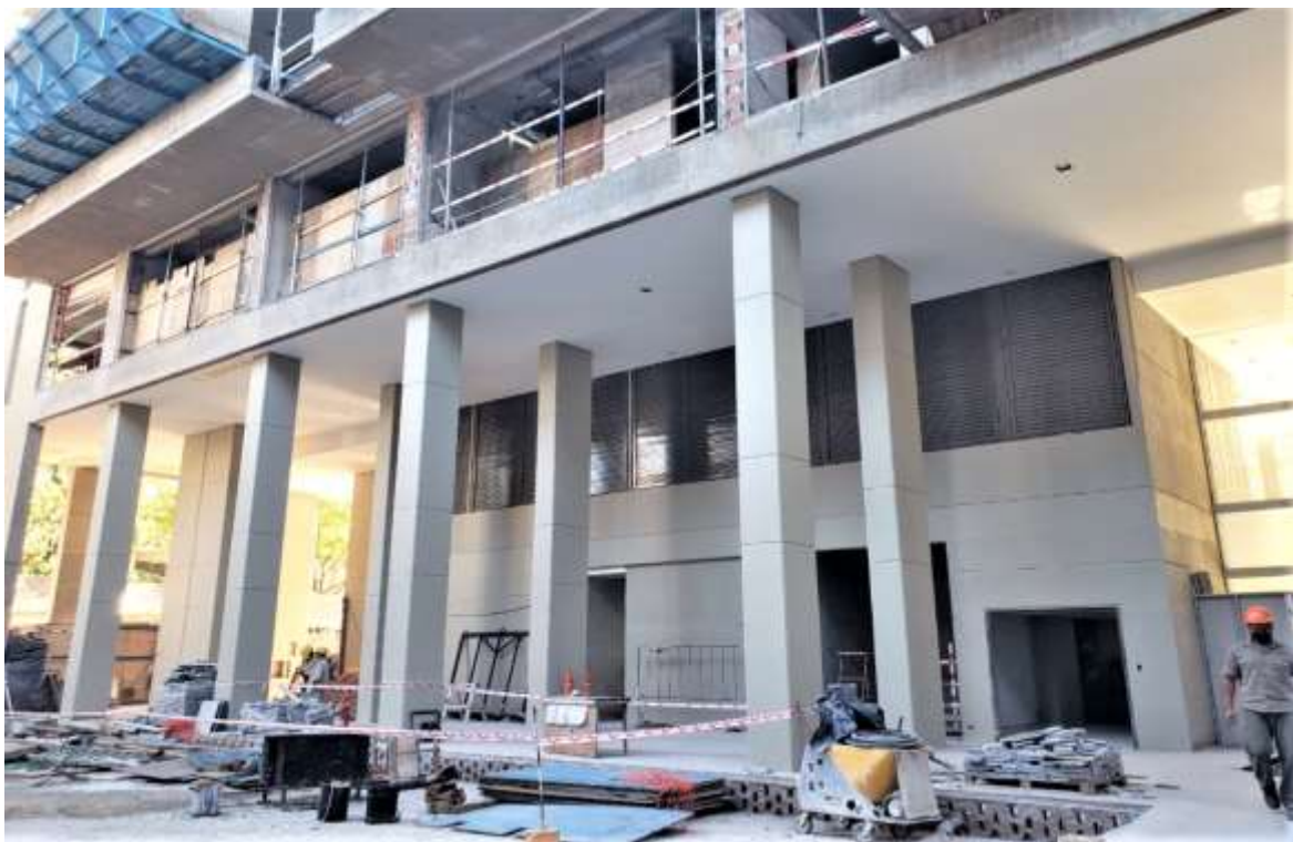
Planta Baja – Pintura y Reja EP Contrafrente