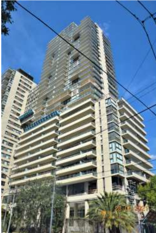
Vista desde calle Arcos