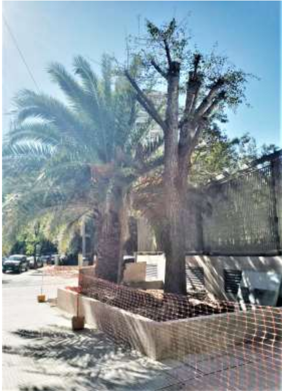
Planta Baja – Cantero Esquina