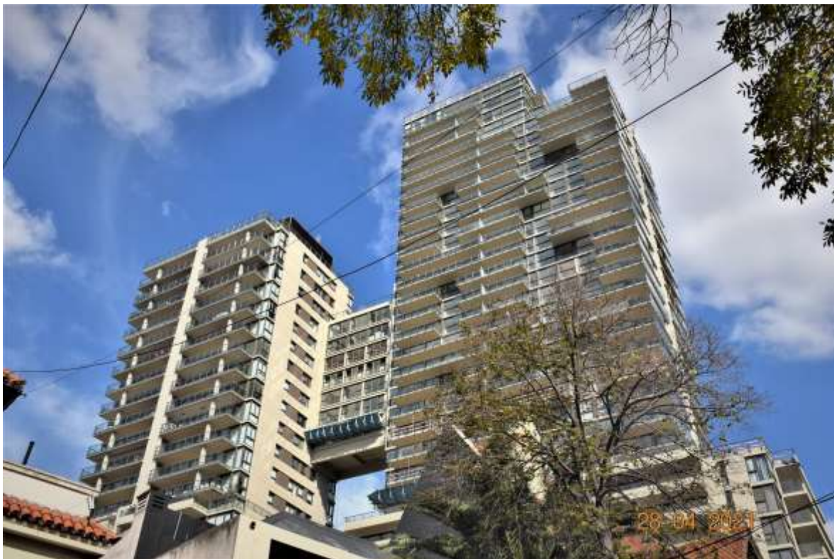
Vista desde Calle Loreto