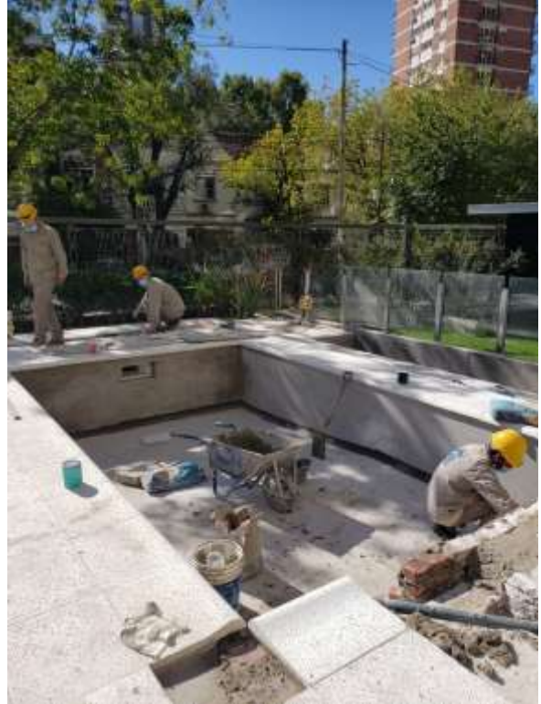
Planta Baja – Terminaciones Piscina Niños