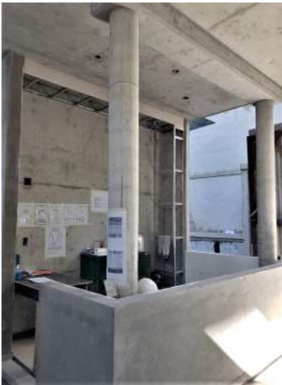
Planta Baja – Garita Loreto