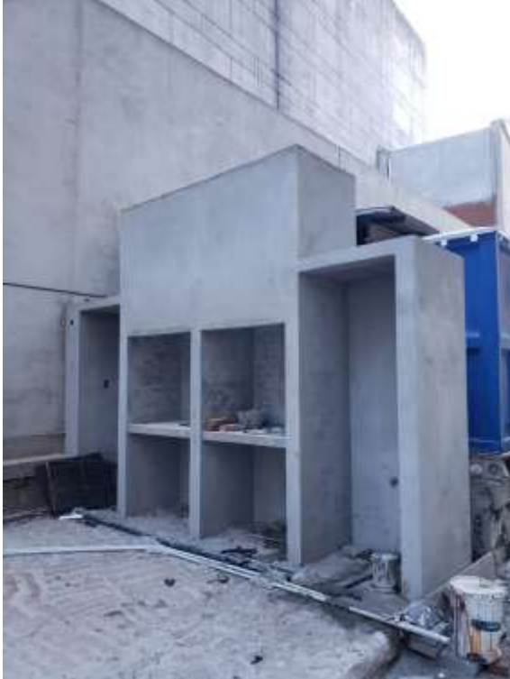
Planta Baja – Revoque Parrillas Cfte.