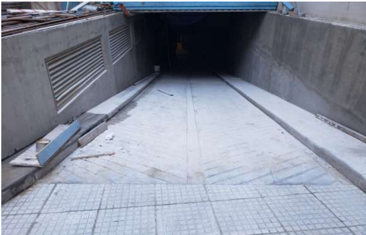
Planta Baja – Rampa Loreto