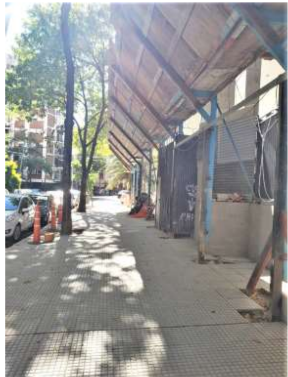
Planta Baja – Vereda Loreto