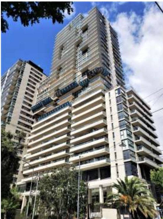
Torre Arcos – Vista Calle Arcos