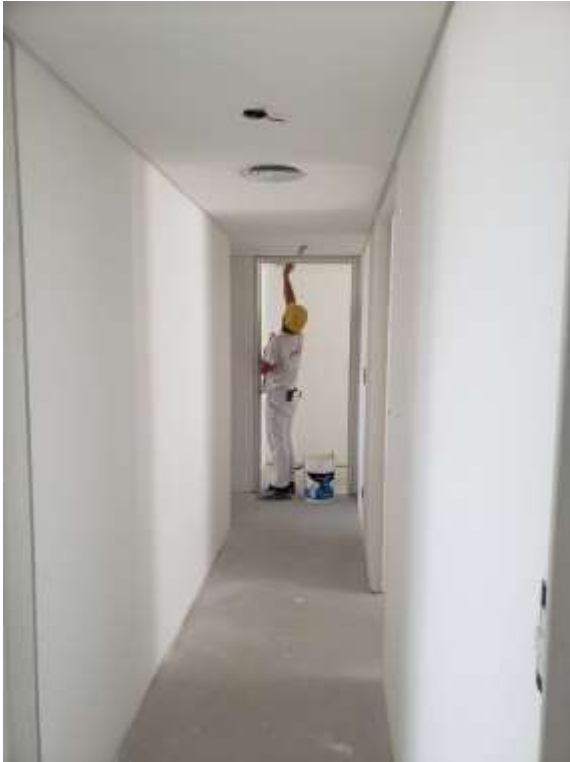
Piso 18°. Pintura