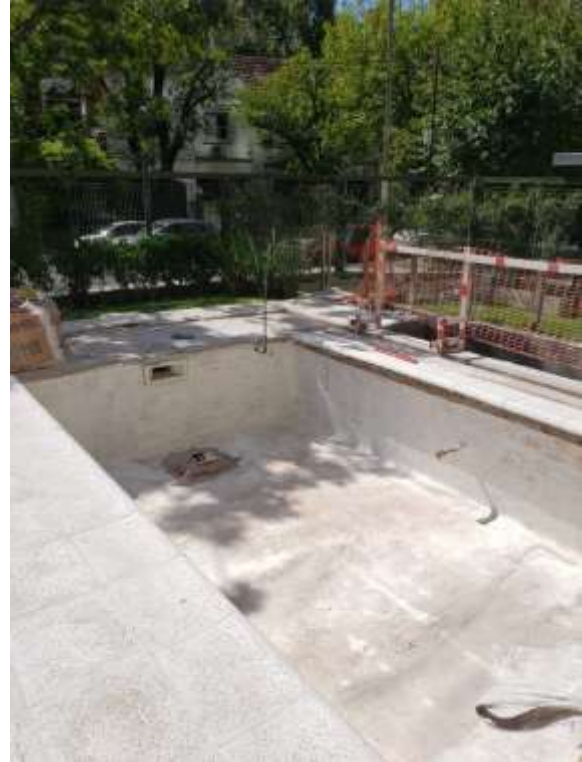
P. Baja – Aislación Pileta Chica