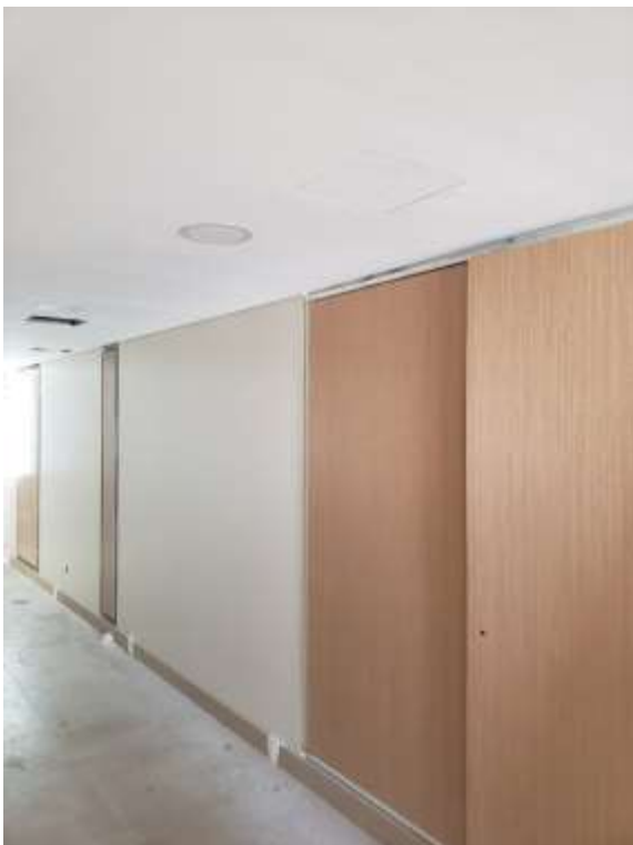
Pintura y Artefactos Palieres