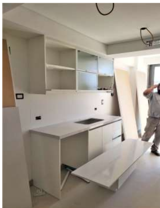
Piso 18º. Instalación Mesadas