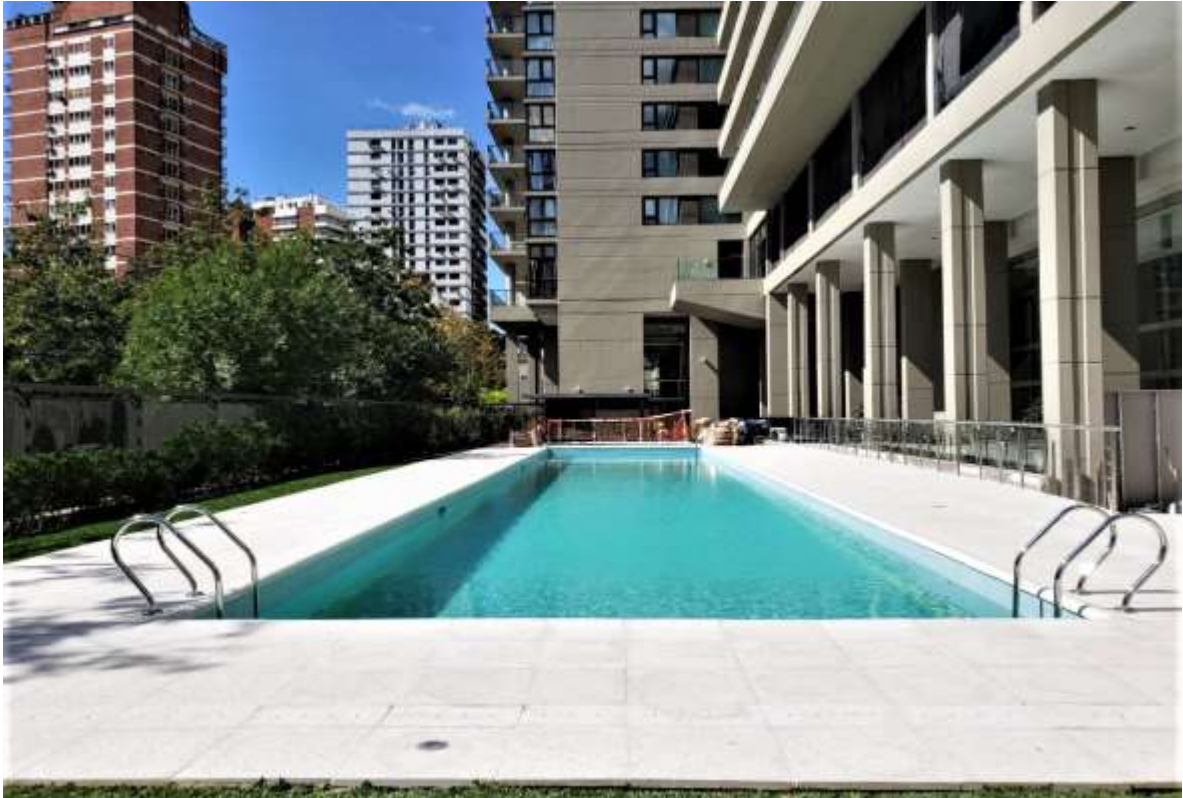
Planta Baja – Pileta Principal