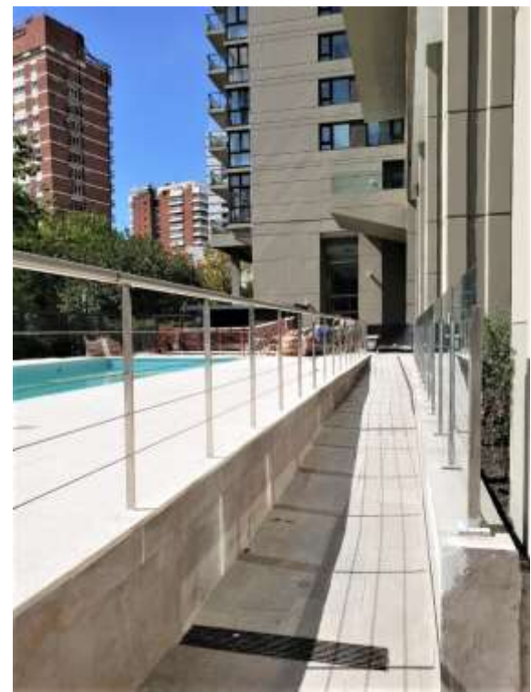
P. Baja – Barandas Rampa