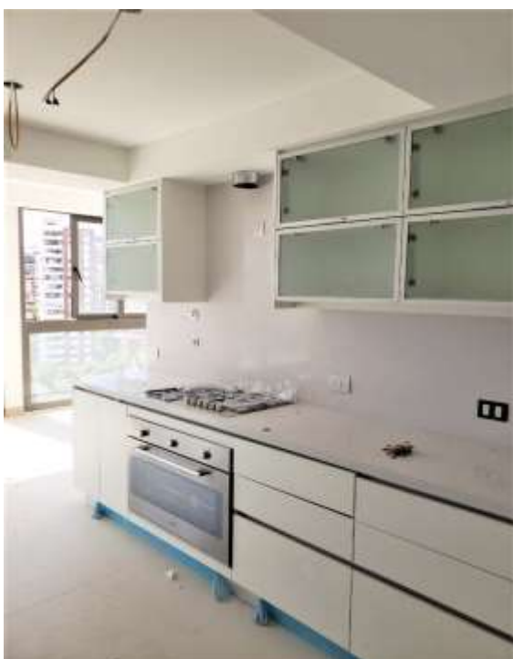
Piso 14º. Muebles de Cocina