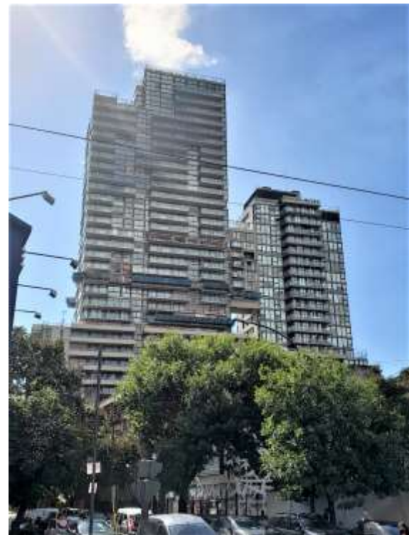
Vista General desde Av. Cabildo