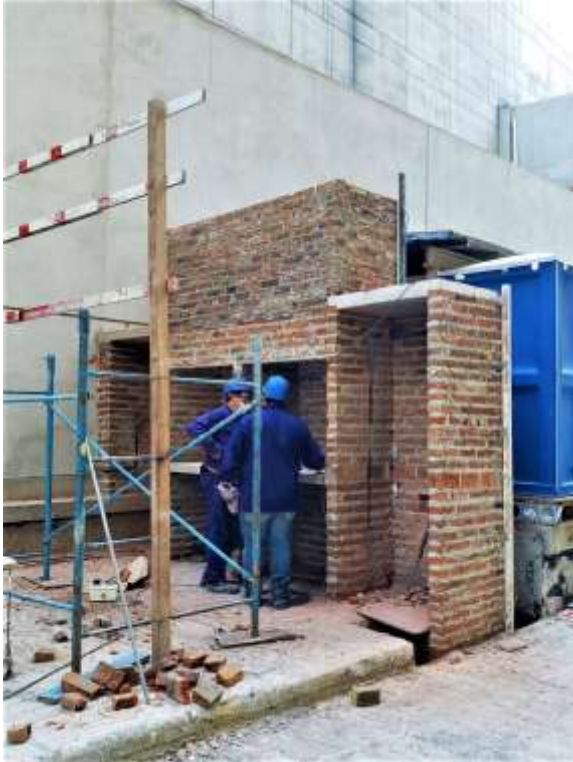
P. Baja – Parrillas Contrafrente