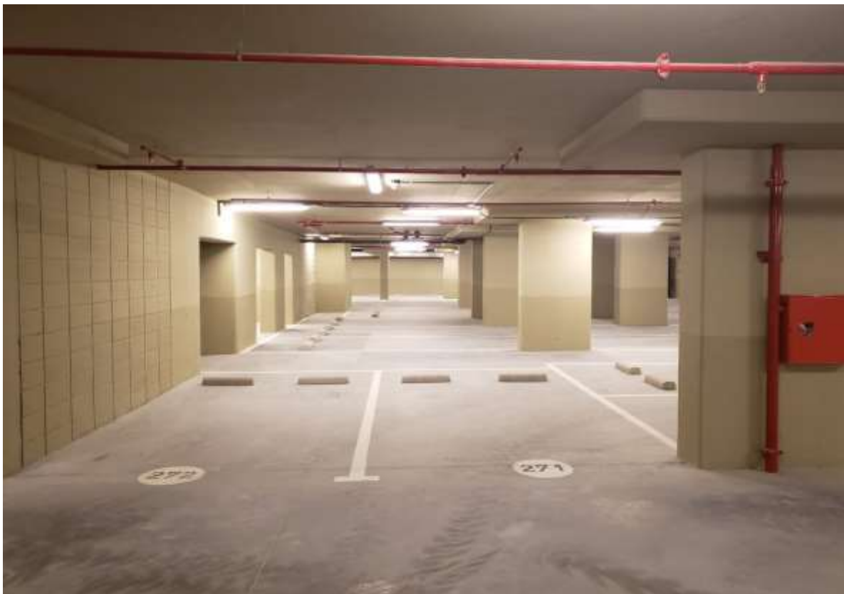
2º.Subsuelo – Demarcación Cocheras y Topes de Estacionamiento