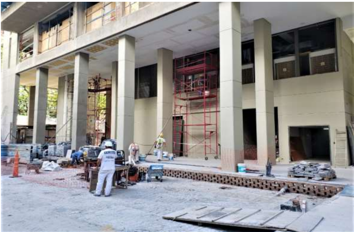
Planta Baja – Pintura Sector Contrafrente