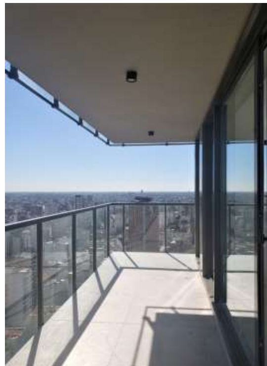
Piso 30°. Vista Balcón