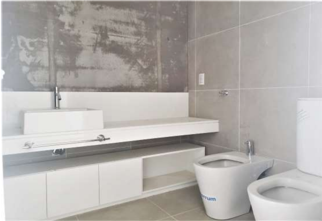
Piso 19°. Baño Secundario