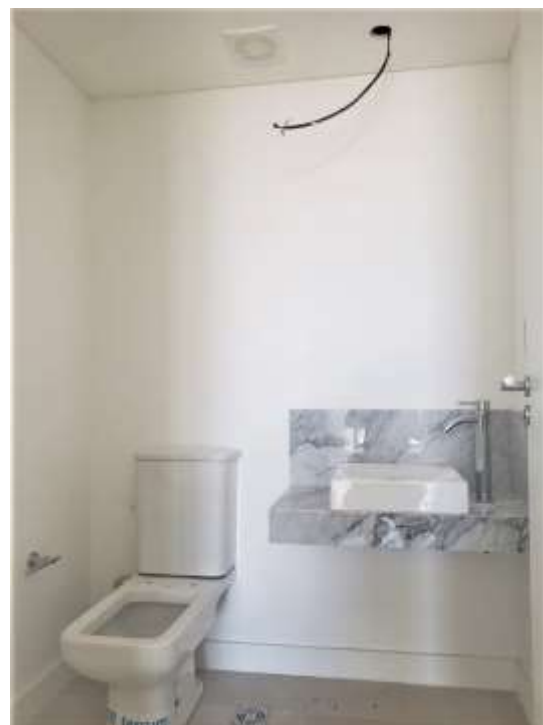
Piso 30°. Toilette