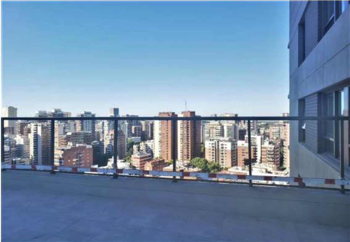
Piso 22°. Estructura Baranda Terraza