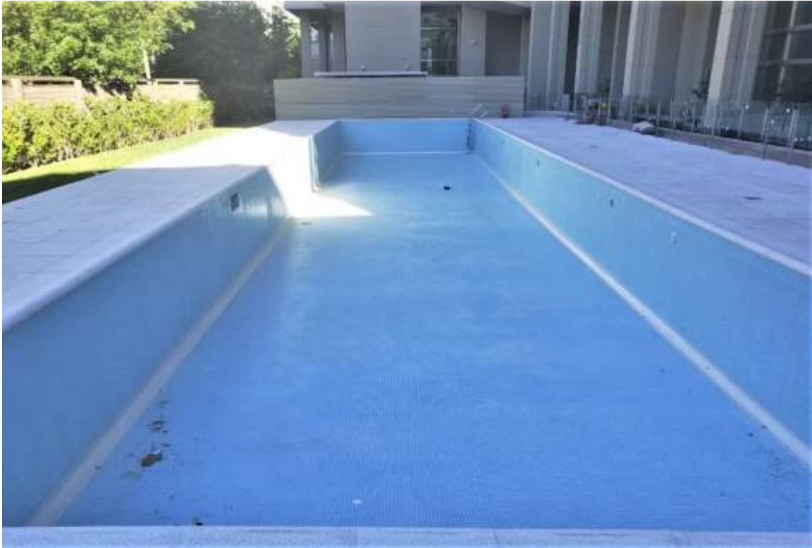
Planta Baja – Pintura Pileta