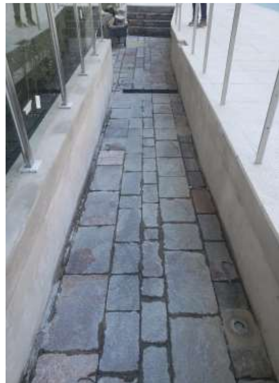
Limpeza Pórfido Rampa