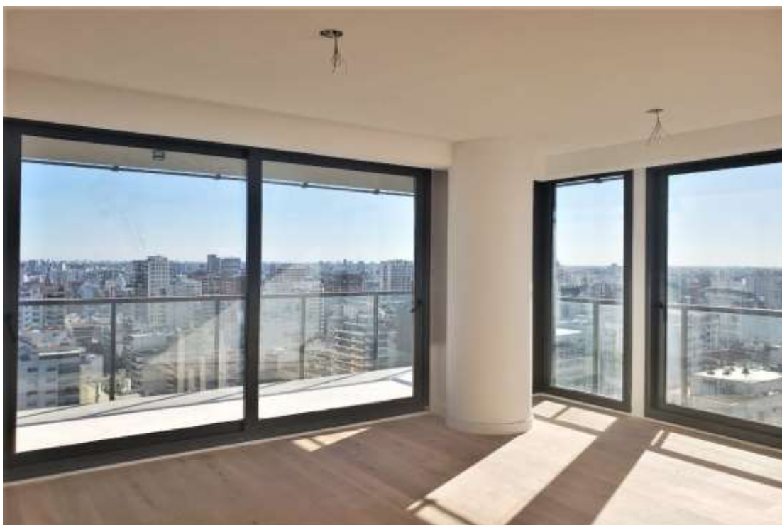
Piso 19°. – Carpintería Estar-Comedor

A continuación, se pueden observar algunas fotografías de los trabajos ejecutados y en ejecución: