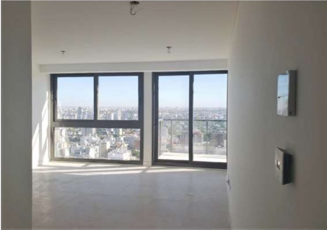
Piso 30°. Vista Estar Comedor