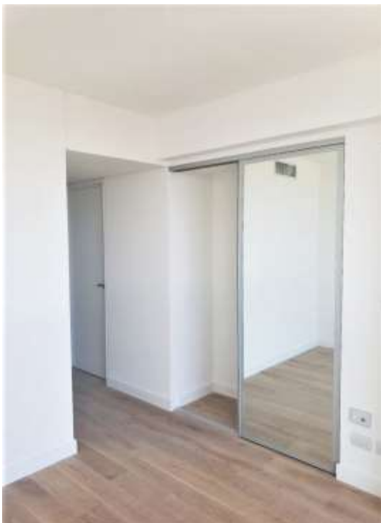
Piso 19°. Dormitorio Secundario