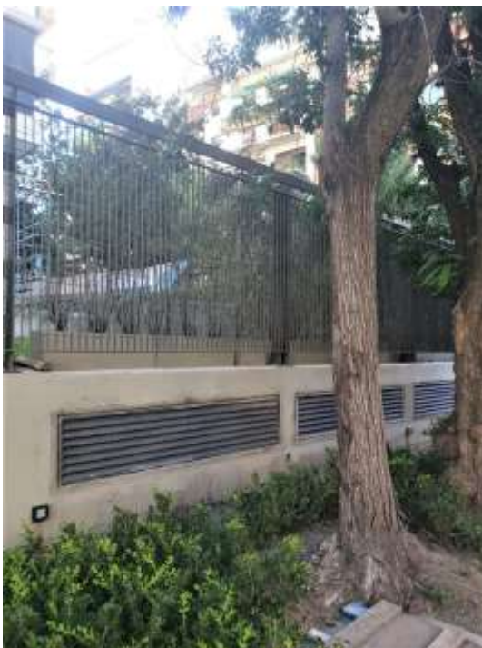
Planta Baja – Reja Exterior