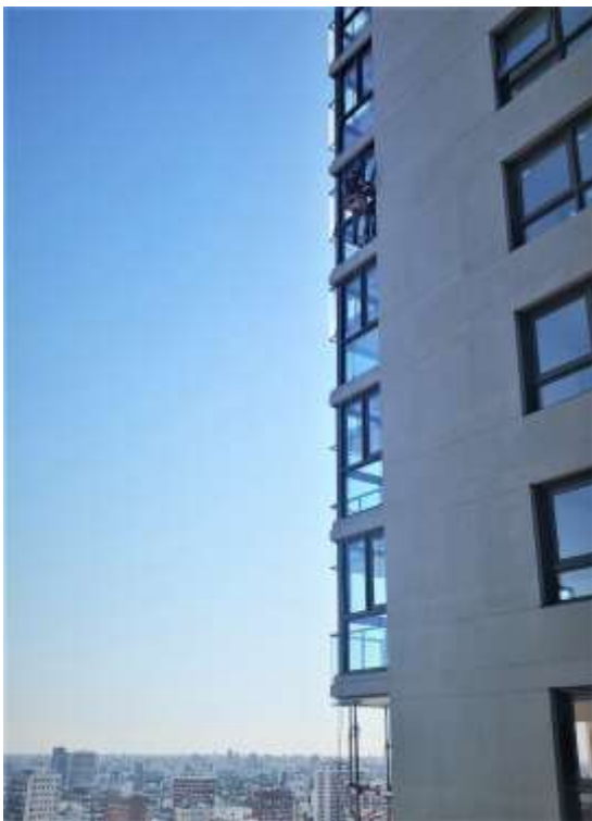
Sellado Carpinterías Exteriores