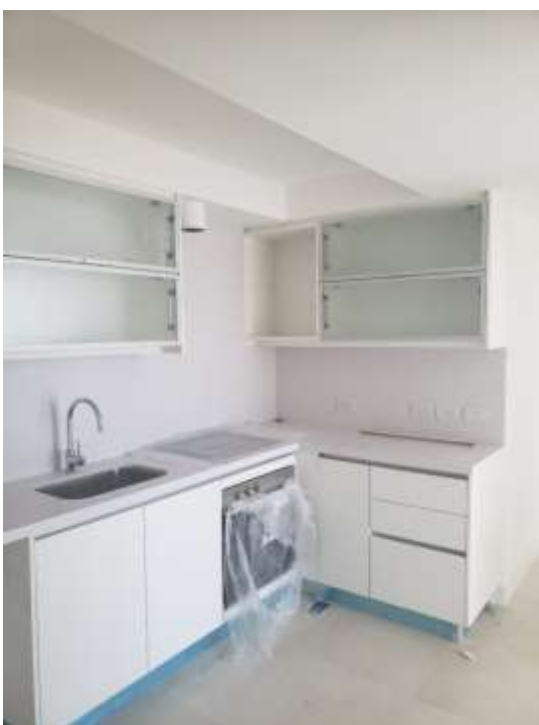
Piso 30°. Cocina