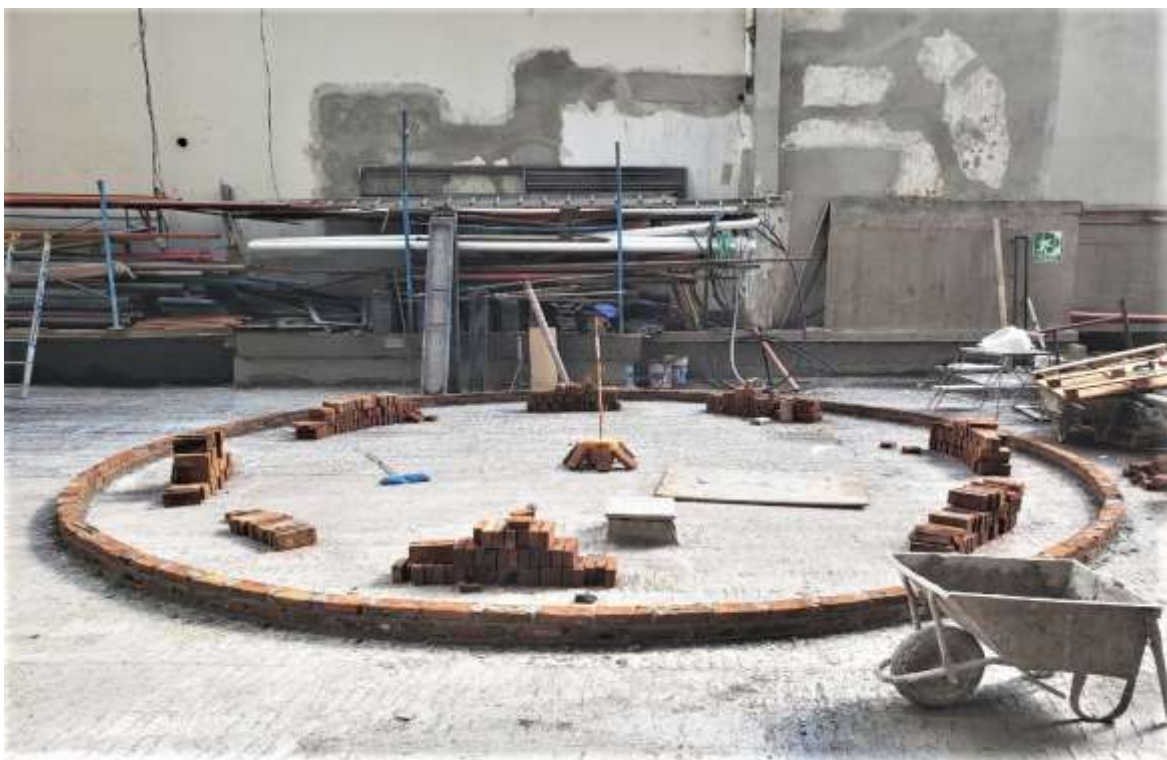
Planta Baja – Mampostería Contrafrente Sector Juego de Niños