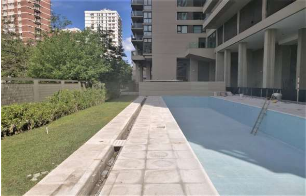
Planta Baja – Solado Solárium – Venecita Pileta – Jardinería