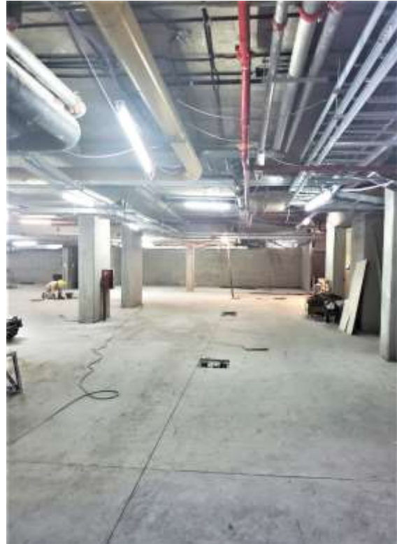
Primer SS – Llano 3ª. Etapa