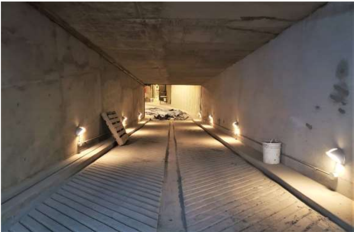
Primer Subsuelo – Solado e Iluminación rampa

A continuación, se pueden observar algunas fotografías de los trabajos ejecutados y en ejecución: