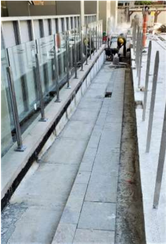
PB- Barandas y Solado en Rampa