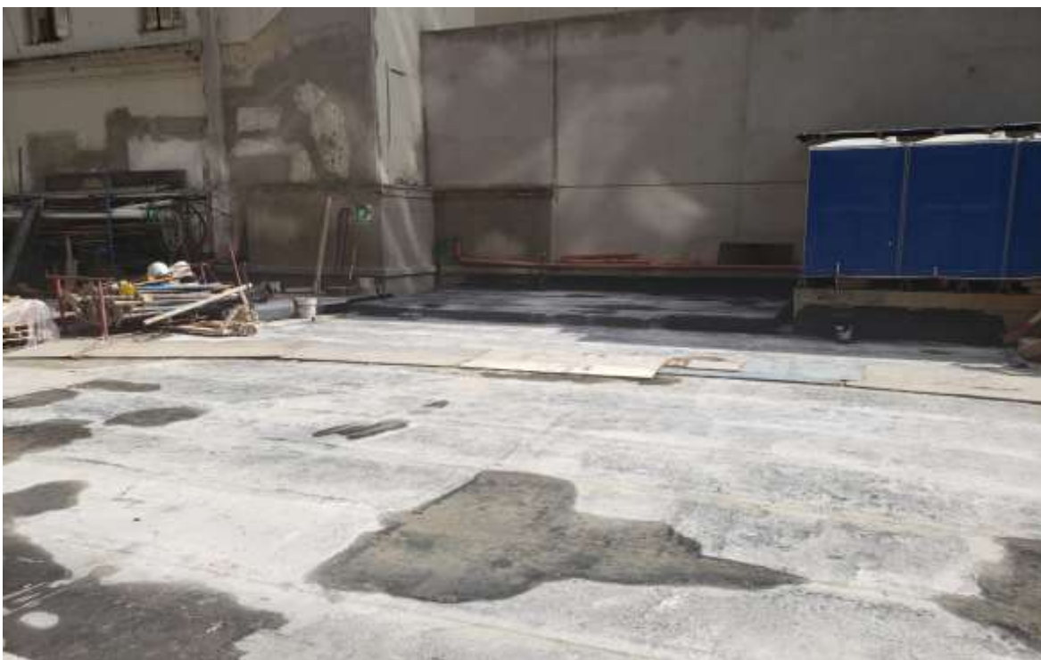
Planta Baja – Aislaciones Contrafrente