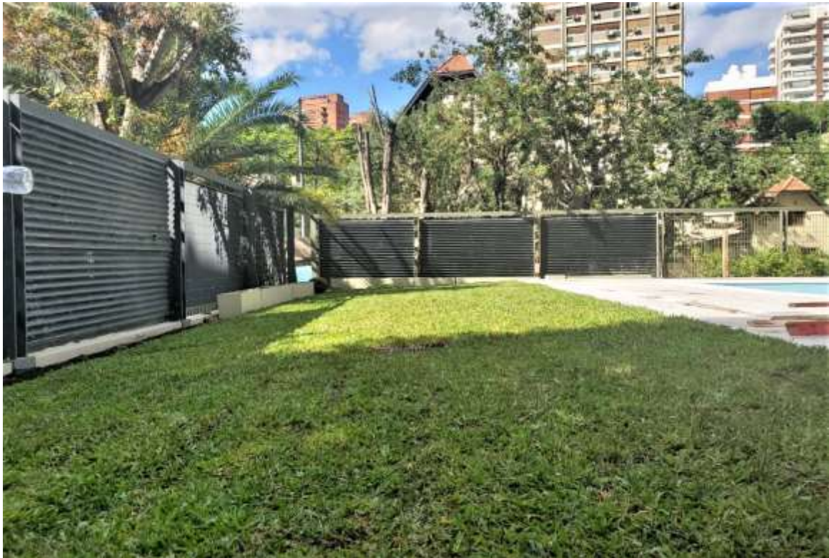
Planta Baja – Jardinería Sector Pileta