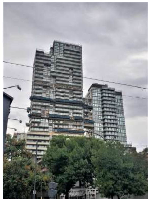
Vista de Avenida Cabildo