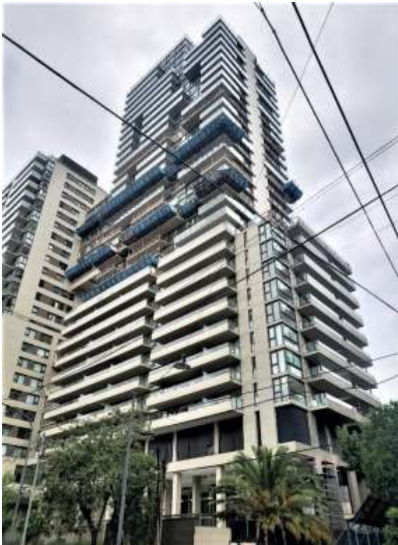
Vista desde Calle Arcos