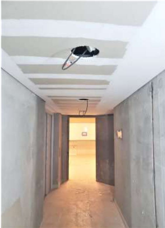
Primer SS – Emplacado Palier