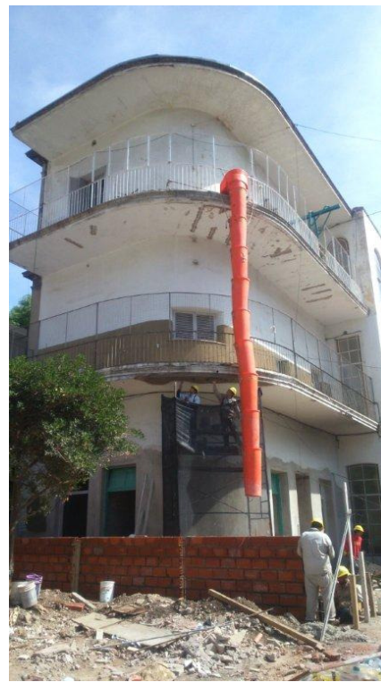
Etapa 2 – Retiro escombros 2º.P