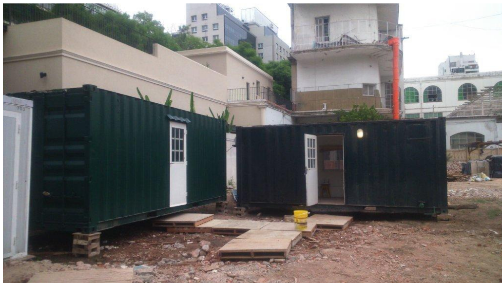
Instalación provisoria de Obradores