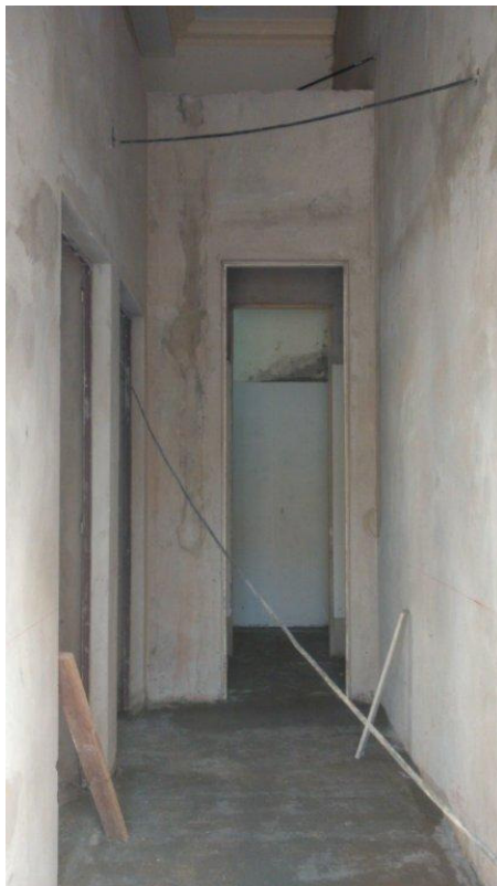
Etapa 1C – Carpetas y revocos