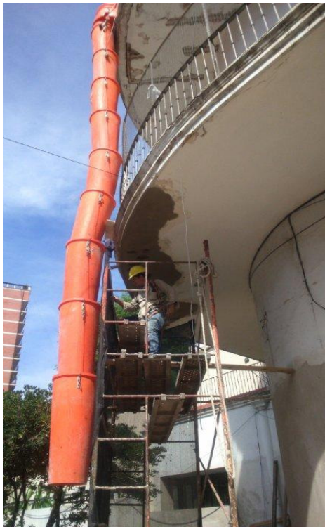
Etapa 1C – Reparación bajo balcón