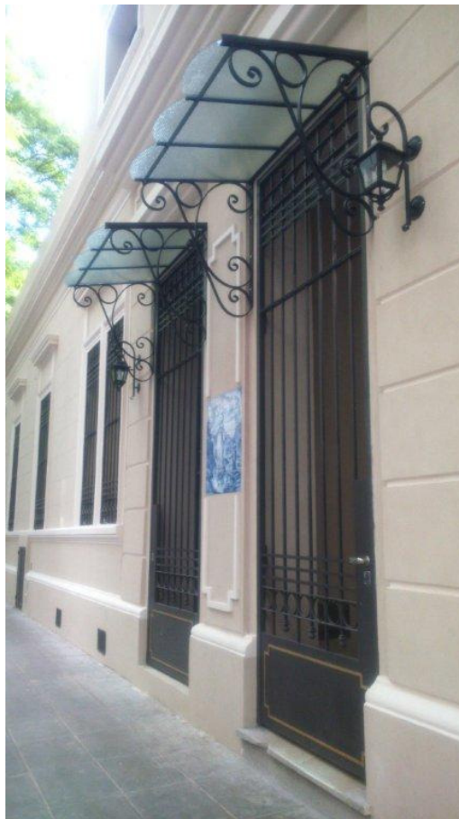
Etapa 1B – Marquesinas Fachada

A continuación se pueden observar algunas fotografías de la situación actual de la obra en el Colegio, correspondientes al completamiento de la Etapa 1B, avance de la Etapa 1C e inicio de la Etapa 2: