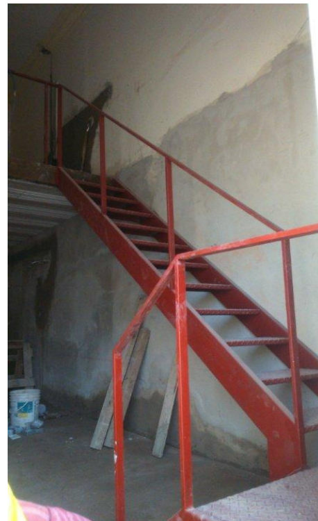
Etapa 1C - Escalera Entrepiso