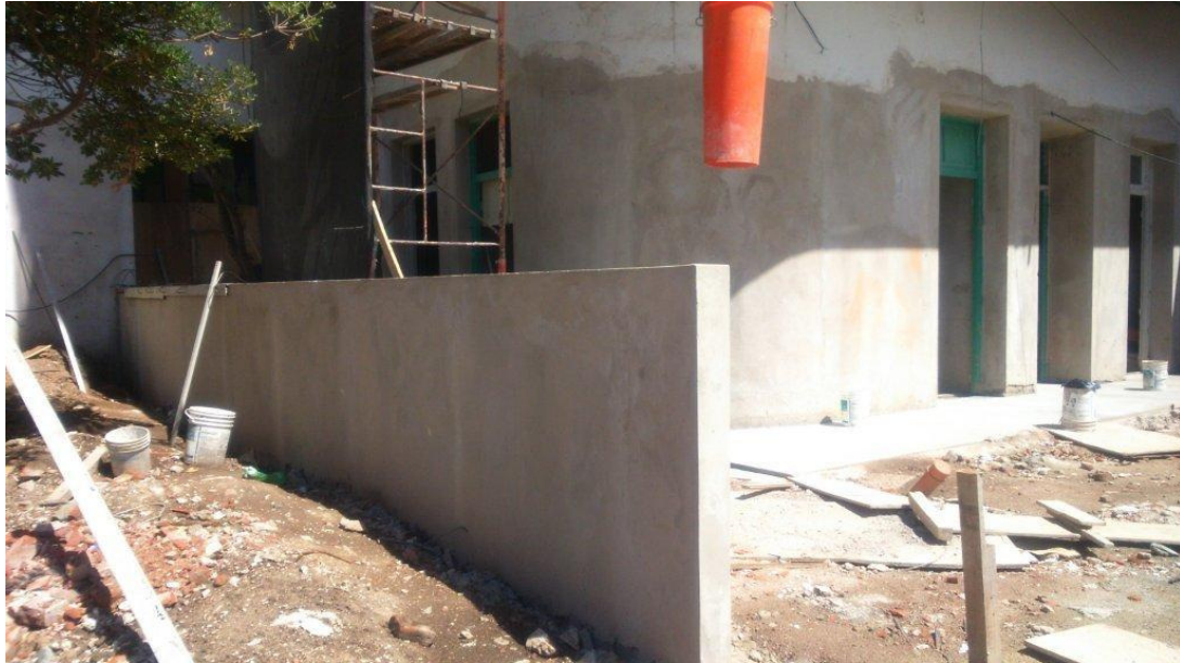
Etapa 1C – Ejecución muro divisorio