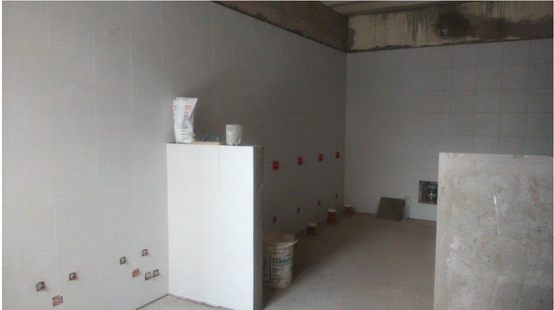
Etapa 1C – Sanitario Alumnos