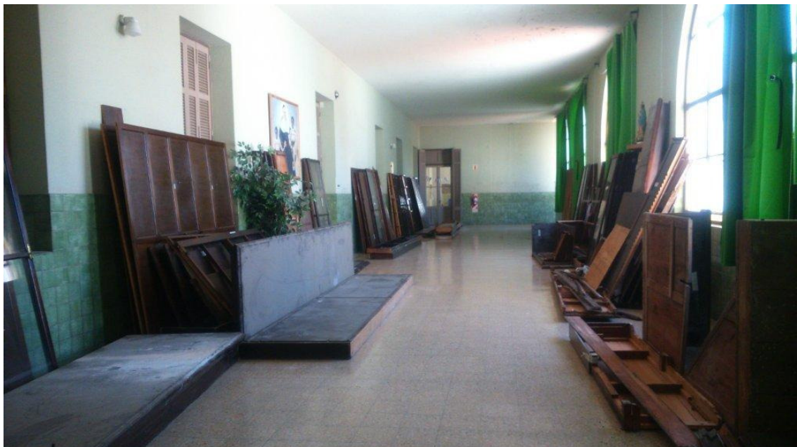
Etapa 2 - Retiro Mobiliario Escolar