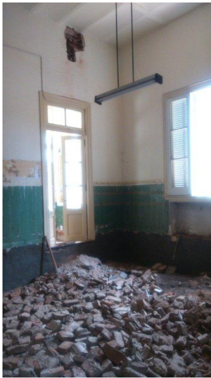
Etapa 2 – Demolición solado Aulas