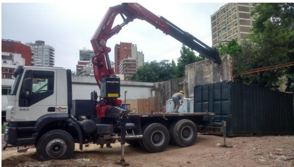
Ingreso de Obradores a la Obra

A continuación se pueden observar algunas fotografías de los trabajos ejecutados: