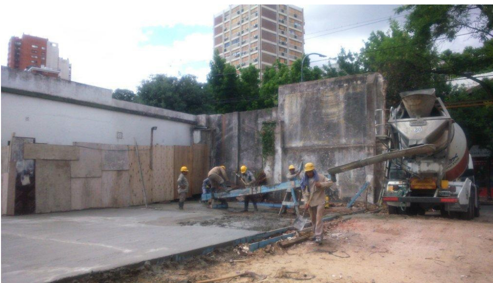
Ejecución de Playón para Obradores