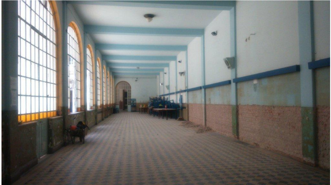
Etapa 2 - Retiro revestimiento paredes Salón Azul