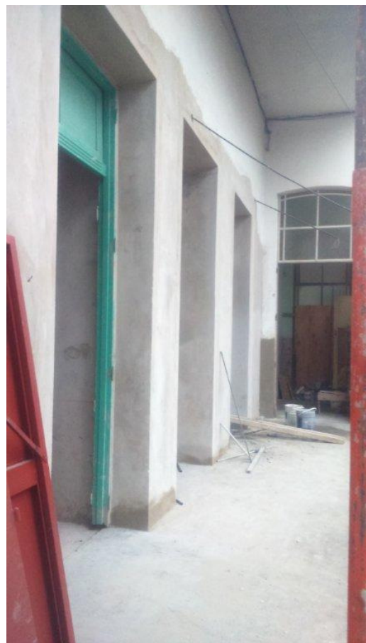
Etapa 1C – Solado exterior y Marcos Carp.