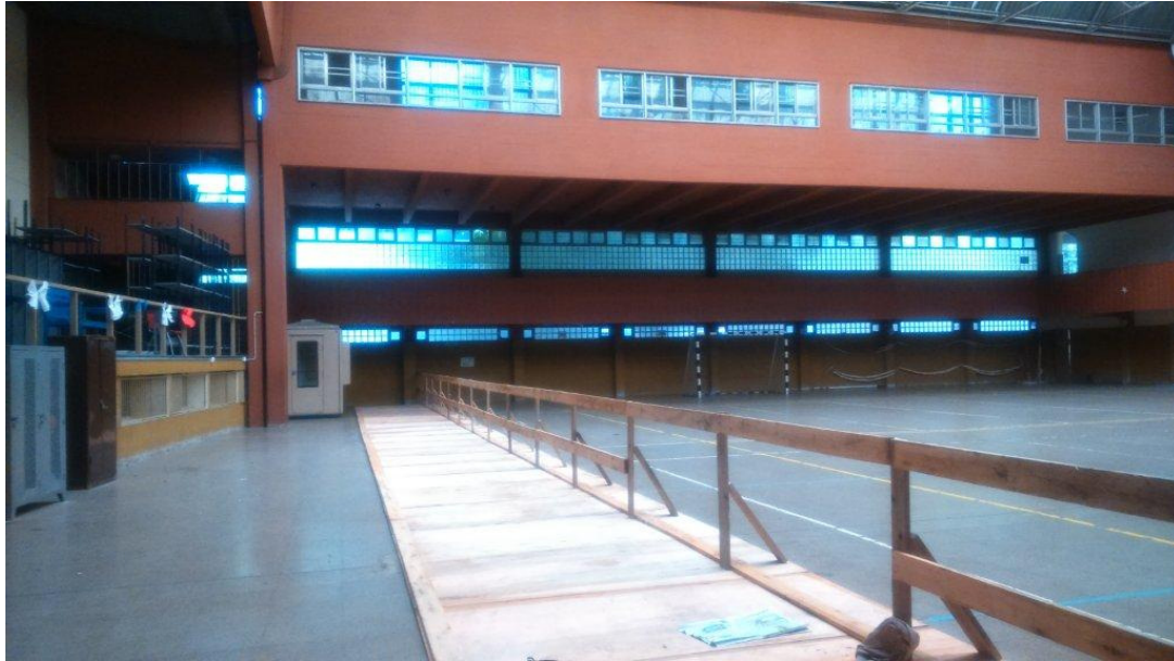
Etapa 2 – Protección solado Gimnasio